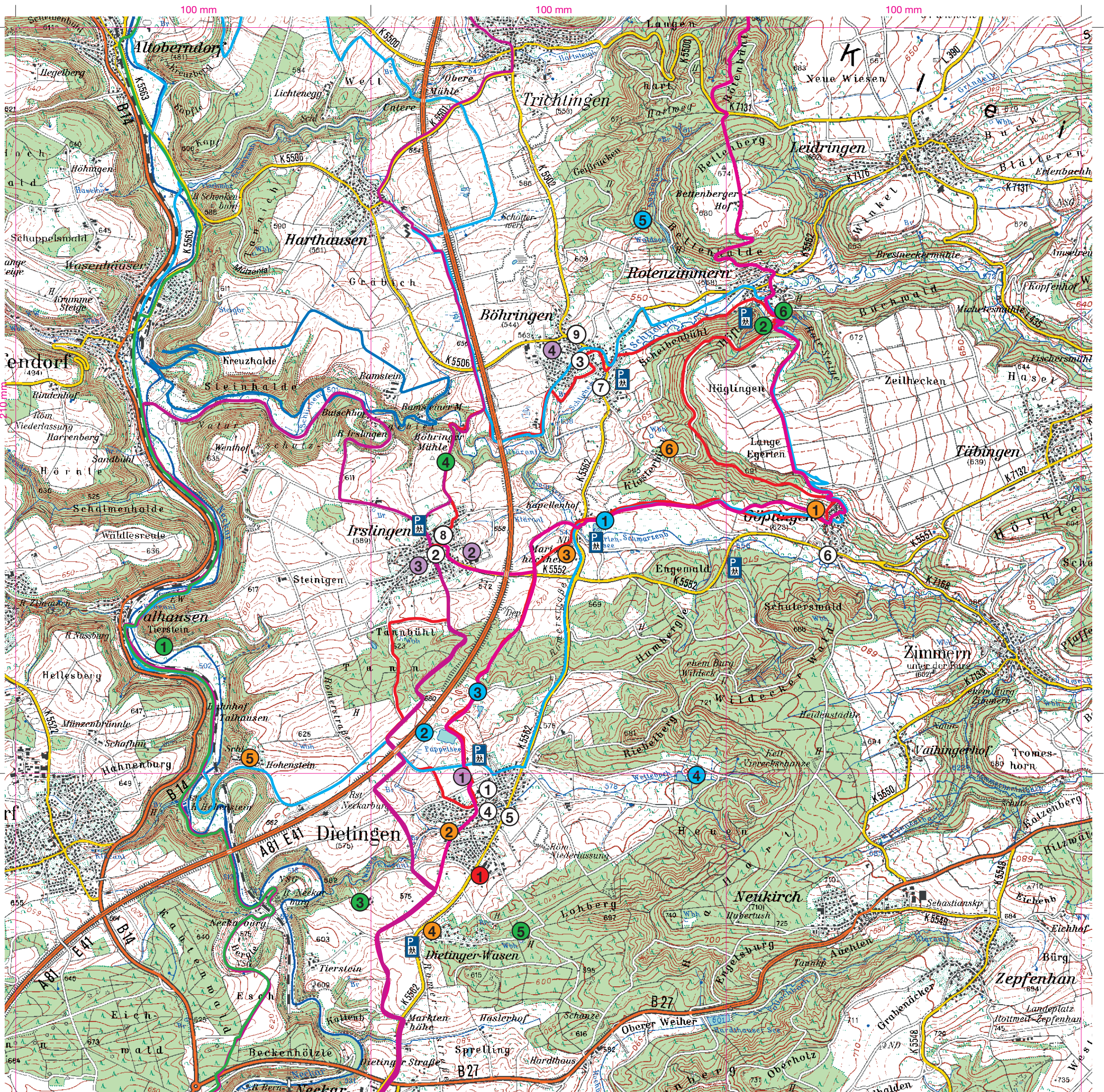
Grundlage: Topographische Karte 1:50.000 –, vom 30.08.2013, Az.: 2851.2-A/8573.