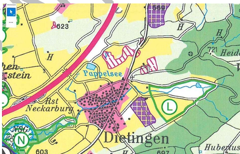
Bild: Auszug aus der Raumnutzungskarte Regionalplan 2003

Im derzeit rechtswirksamen Regionalplan 2003 des Regionalverbands Schwarzwald – Baar – Heuberg ist das Plangebiet als Vorrangflur für Landwirtschaft und Bodenerhaltung dargestellt. Diese Festsetzung umgibt nahezu die gesamte Ortslage von Dietingen. Innerörtliche Flächen wurden vergeblich versucht zu aktivieren. Insofern ist die Inanspruchnahme dieser Vorrangflächen alternativlos.